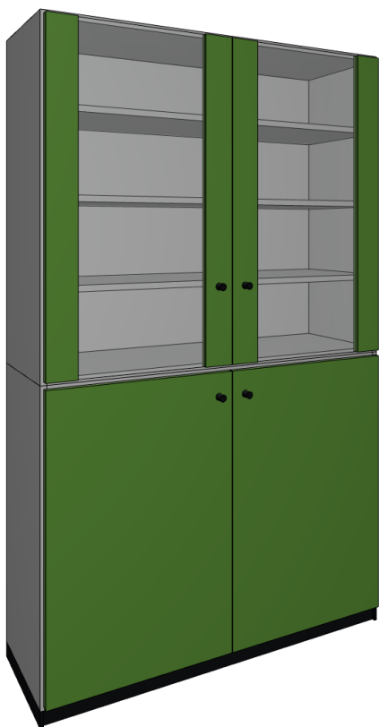
vizualizace uzamykatelné skříně

Před zahájením výroby, objednáním, nebo zabudováním PSV. budou na stavbě ověřeny stavební rozměry, způsob zabudování a stavební návaznosti a barevné řešení. Součástí dodávky výrobků bude i dílenská dokumentace výrobků PSV. Dílenská dokumentace bude předložena k odsouhlasení investorem a architektem stavby. Veškeré výrobky, pohledové materiály, spoje, styky atd. budou na stavbě vyzorkovány a odsouhlaseny autorem návrhu. Nedílnou součástí projektové dokumentace je D.1.1a – Technická zpráva a D.1.3 – Požární bezpečnostní řešení i jiné související části projektové dokumentace.